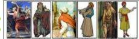
Jefté Ibsán Elón Abdón Sansón Samud