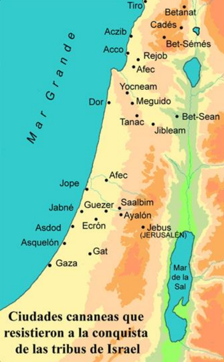
Ciudades cananeas que resistieron a la conquista de las tribus de Israel