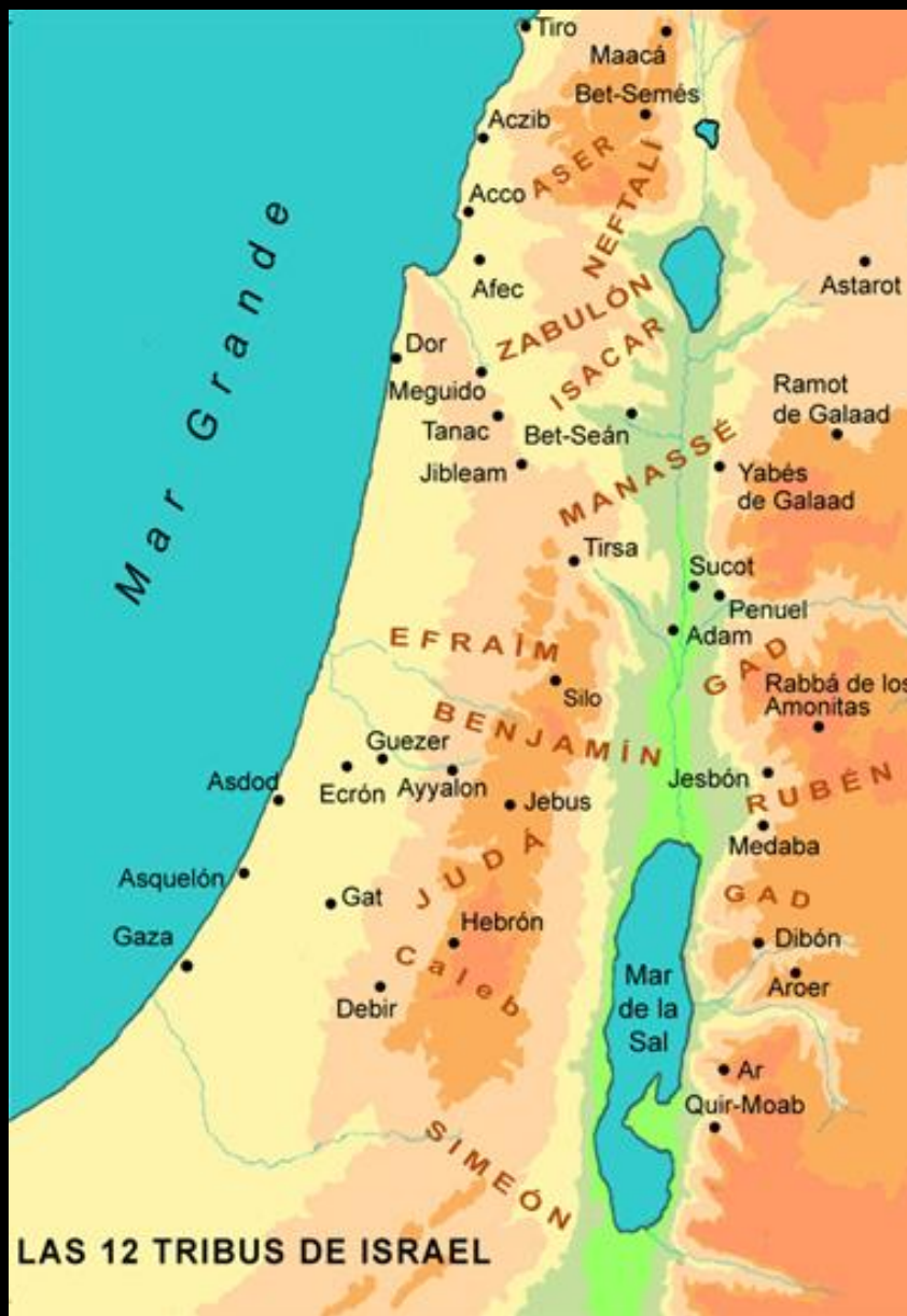
LAS 12 TRIBUS DE ISRAEL