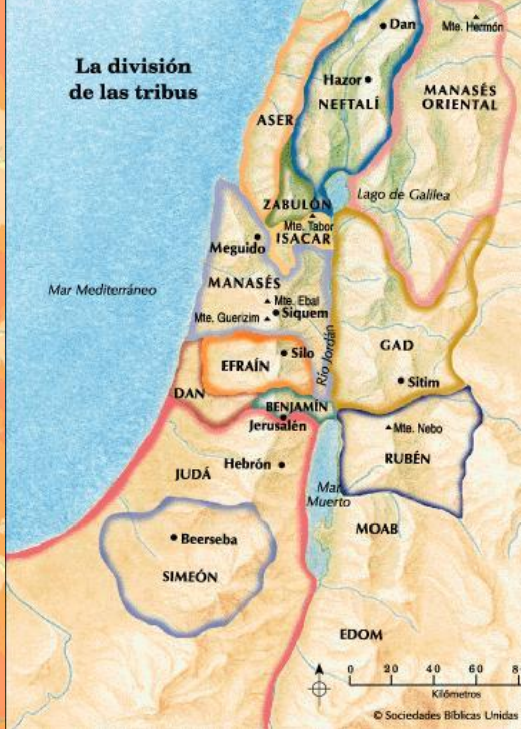
La división de las tribus