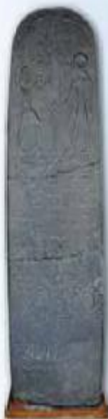
Estela de Seti I (Bet Seán, 1290 a. C.)