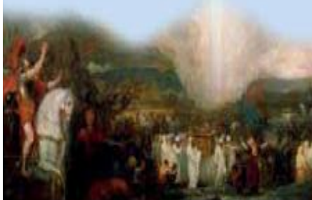
Josué cruzando el Jordán con el Arca de la Alianza, de Benjamin West (1800, Museo de Nueva Gales del Sur)