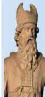
Aarón el levita, de Joseph Sec (1792, Aix-en-Provence)