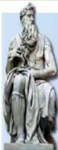
Moisés, de Miguel Ángel (siglo XVI, Roma)