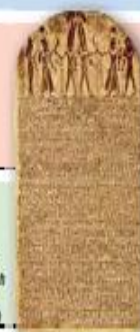
Estela de Merneptah (Tebas, 1250 a. C.)