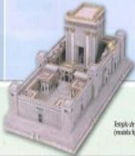
Templo de Salomón (modelo legendado)