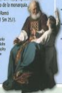
El y el pequeño Samuel, de John Singleton Copley (1780, Museo Wadsworth Athleten)