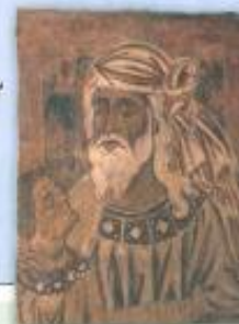
Salomón y Roboán, Monasterio de Sigüenza (MNAC, Barcelona)

Forma con las tribus del Sur (Judá y Benjamín) el Reino de Judá, con capital en Jerusalén.