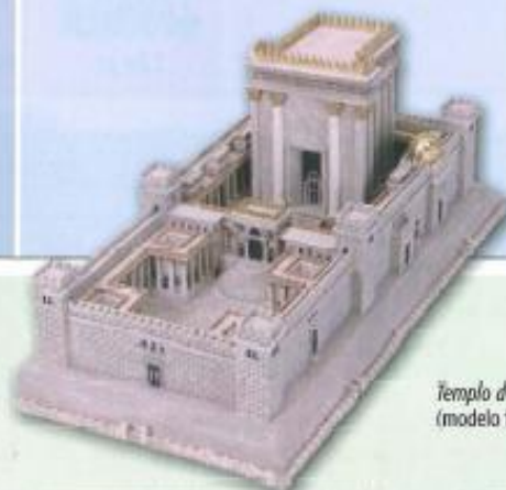
Templo de Salomón (modelo figurado)