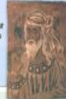
Salomón y Roboán, Ministerio de Sigos (MNAC, Barcelona)

Hijo y sucesor de Salomón. Forma con las tribus del Sur (Judá y Benjamín) el Reino de Judá, con capital en Jerusalén.