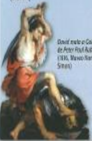
David mata a Goliat, de Peter Paul Rubens (1634, Museo Hermitage, San Petersburgo)