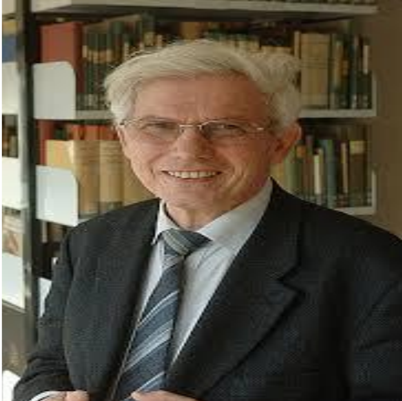
THEISSEN, Gerd. El Nuevo Testamento. Historia, literatura. Religión. P. 23

“La Biblia es uno de los libros más presentes en nuestra cultura y al mismo tiempo uno de los más desconocidos”