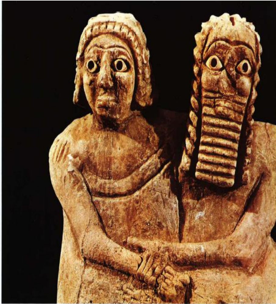
4. Estatuilla doble proveniente de Nippur, que representa una pareja. Cultura Protodinástica; primera mitad del III milenio a.C. Museo Nacional de Bagdad.